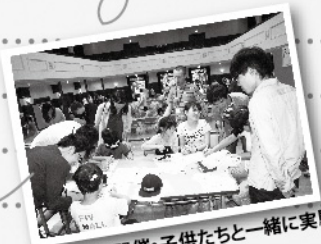
初の郡山開催・子供たちと一緒に実験