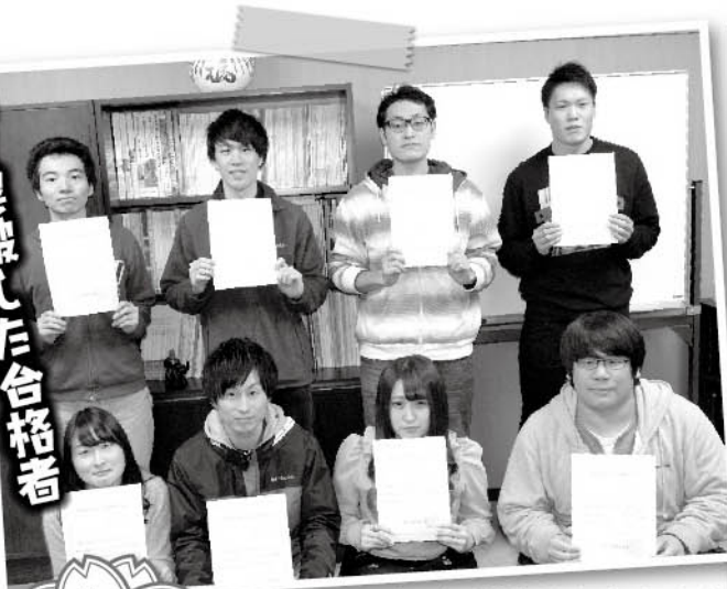
▲今年度の合格者、第1種1名、第2種7名