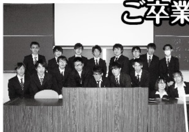
研究分野ごとに卒業研究発表が行われました。 メカトロ1・生体系の皆さん

卒業を迎えられた皆さま、保護者の皆さま 心よりお祝い申し上げます。 今後のご活躍をお祈りいたします。