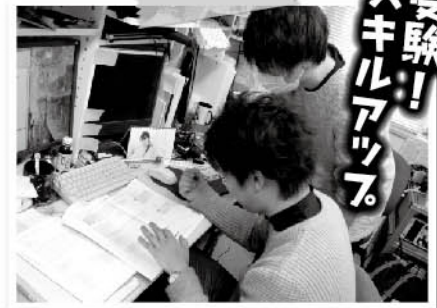
▲ 研究の合間に英語の勉強をする学生