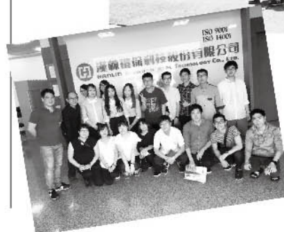
漢林環保科技股份 有限公司