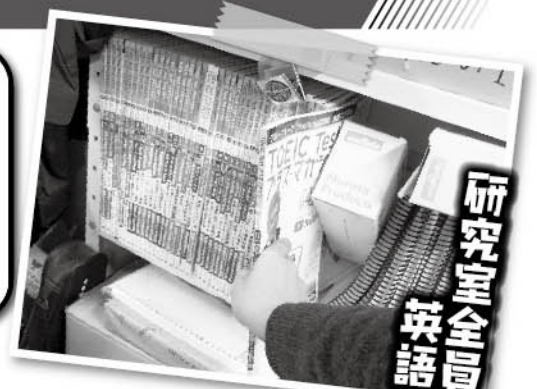
▲ 研究室にあるTOEICの教材

そのときの結果が散々だったので、研究室の教材を活用しながら勉強したところ、去年よりも良い点数が取れ、お褒美をもらえることになりました。最近は洋画のセリフが聞き取れるようになったり、自分でも成長を実感しています。来年以降配属される後輩たちにとっても、良い機会になると思います。今後も研究と両立しながら英語を学んでいきたいと思っています。