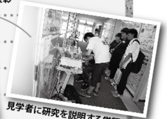
見学者に研究を説明する学類生