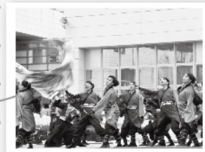
今年は2日目雨天の為、野外イベント中止