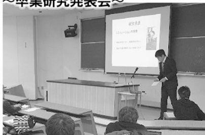
メカトロニクス1系