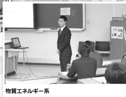
物質エネルギー系