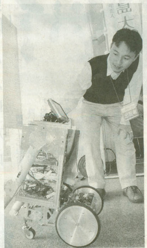
「倒立二輪型ロボット」を紹介する福島大共生システム理工学類の担当者