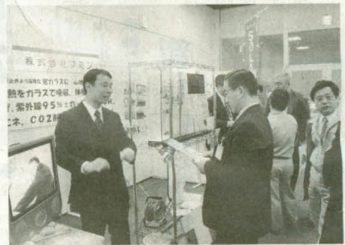
出展企業の説明に聞き入る人でにぎわう企業ブース

のソフトなど二十五企業がブースを設け、来場者に事業の特長を紹介。福島大共生システム理工学類の福祉保健医療技術プロジェクトの展示も行っており、将来は重い物を持ちたり、ごみを拾ったりできるようになる開発中の「倒立二輪型ロボット」モデルなどが並んでいる。